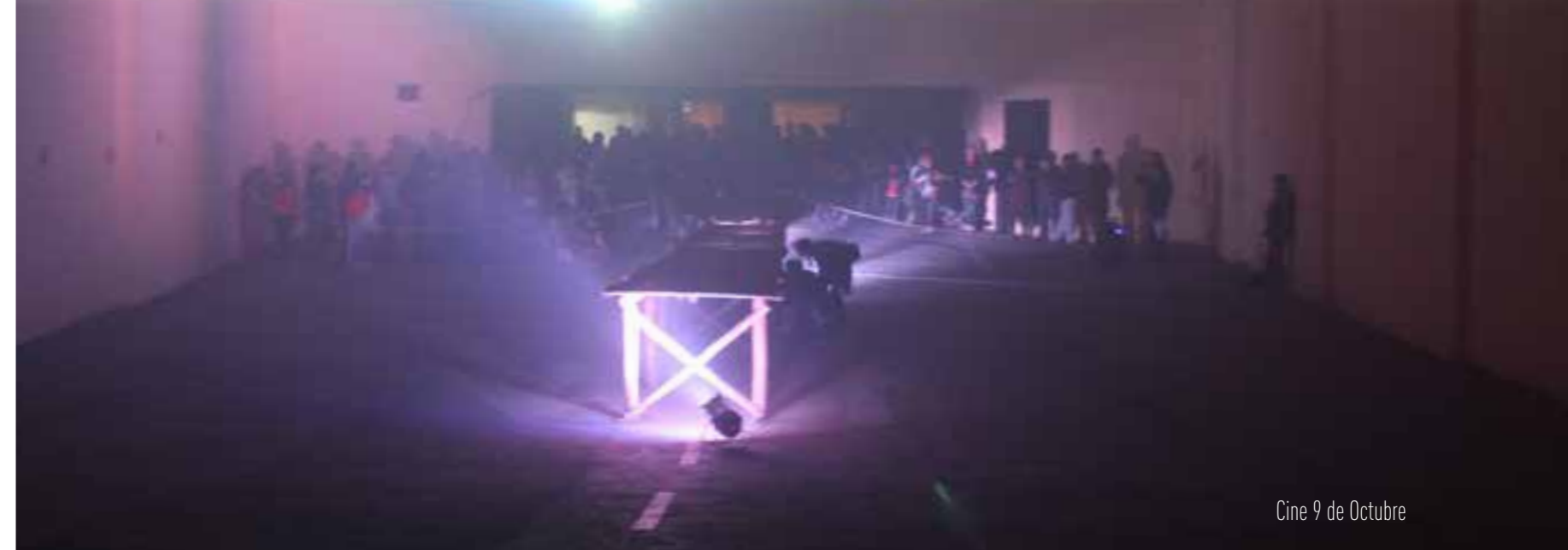
Cine 9 de Octubre

po, para reconstruir la historia de seis salas de cine desde su nacimiento hasta su consumación. Los cines desaparecidos que fueron objeto de la investigación fueron: Teatro Cuenca, Cine Alhambra, Teatro Lux, Cine España, Teatro Candilejas y Cine 9 de Octubre. Este proceso concluyó el jueves 2 de julio, cuando cada grupo presentó la intervención in-situ que realizó en los exteriores y/o interiores de esos teatros y generó una importante plataforma de intercambio y cooperación con vecinos, pobladores y líderes barriales.