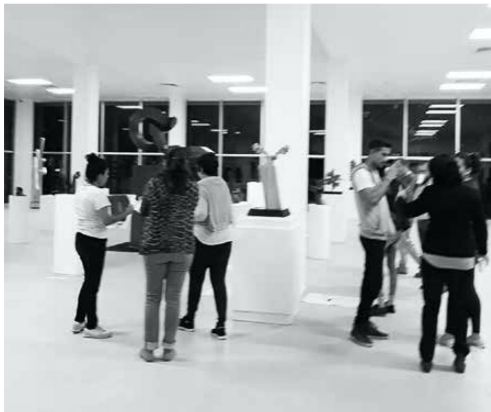
▲ Preguntas frente a las obras. Centro Estatal de las Artes de Comala, Colima, México