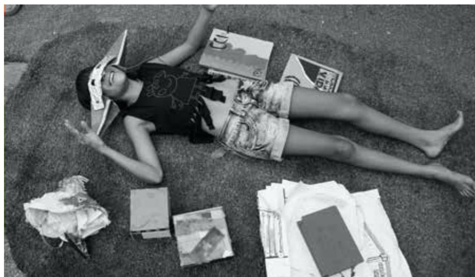
▲ Adolescente rodeada de dispositivos del CCN: libro de visitas, libro de la vida, recetario, cajitas para poemas visuales, dispositivos para mirar.